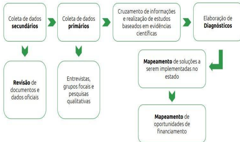
Figura 1 - Processo de Elaboração do Diagnóstico Acrece

O diagnóstico minucioso mostrou-se fundamental para subsidiar debates em fóruns ampliados com participantes de áreas públicas e privadas ao longo das Oficinas Temáticas para a Elaboração do Plano Estratégico, desenvolvidas entre os dias 22 e 25 de outubro de 2024. O processo de elaboração observou o cumprimento de etapas preliminarmente estabelecidas, conforme a Figura a seguir, e a premissa de colaboração dos principais atores regionais.